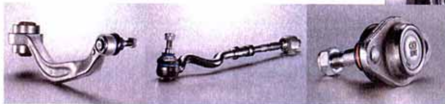
Ob Querlenker, Spurstange oder Führungsgelenk: Man liefere stets Teile in höchster OE-Qualität, betont man bei Ruville.