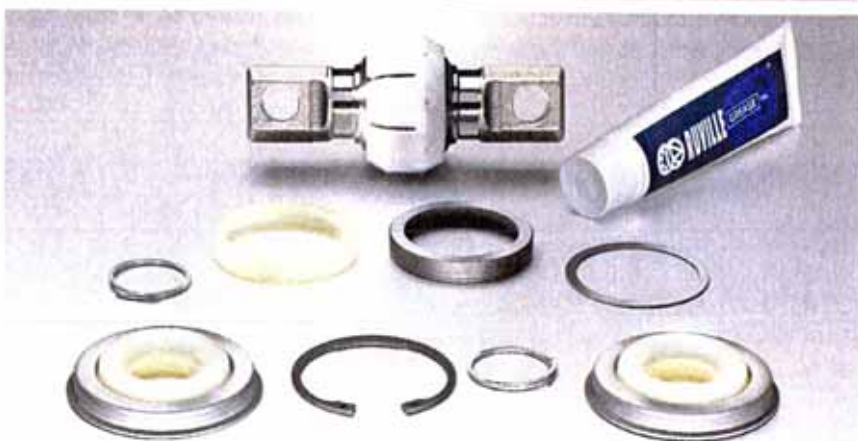
Reparatursatz Strebe MAN. Oben links: Wasserpumpe E-114. Oben rechts: RTK für NKW-Spannrolle