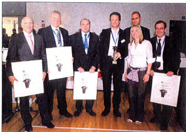
Die Marke Ruville erhielt die Auszeichnung „Supplier of the Year 2008“.

Auch das Schulungsangebot hat Ruville weiter ausgebaut: Im Mittelpunkt stehen alle Produktgruppen, sowie Kataloge, technische Informationen, Neuheiten und Einbauhinweise. ml