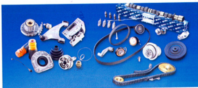
Ruville hat die Zeichen der Zeit erkannt und bietet Einzelkomponenten und Reparatursets für Fahrwerke und Motoren an.