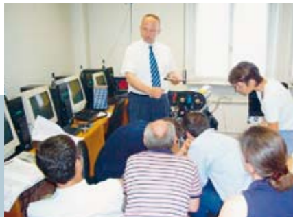
Die Experten von Ruville bieten Schulungsprogramme von unterschiedlichem Umfang an. Dies sind im einzelnen Produkt- und Techniktrainings für Riementrieb- und Ventiltriebkomponenten, Wasserpumpen, Radlager und Radnaben.

Das Hamburger Unternehmen liefert Radlagersätze, Spannrollen, Lenkungsteile und Wasserpumpen sowie Ersatzteile für Zahnriementriebe und Kettentriebe in OE-Qualität für den freien Kfz-Ersatzteilmarkt. Bereits vor 80 Jahren wurde das Unternehmen Egon von Ruville gegründet. Es gilt nach eigener Aussage als Schöpfer des Radlagersatzes. Angefangen bei Radlagersätzen über Spannrollen und Spannrollen-Kits bis zu Komplettprogrammen für alle gängigen europäischen und asiatischen Pkw sowie leichten Nutzfahrzeugen wird unter der Marke Ruville seit über 30 Jahren weltweiter Handel mit Ersatzteilprogrammen für die Bereiche Fahrwerk und Motor betrieben. Heute gehört Ruville gemeinsam mit LuK, INA