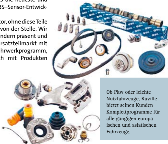
Ob Pkw oder leichte Nutzfahrzeuge, Ruville bietet seinen Kunden Komplettprogramme für alle gängigen europäischen und asiatischen Fahrzeuge.

Dass die kundenorientierte Unternehmensorganisation speziell auf die Belan-